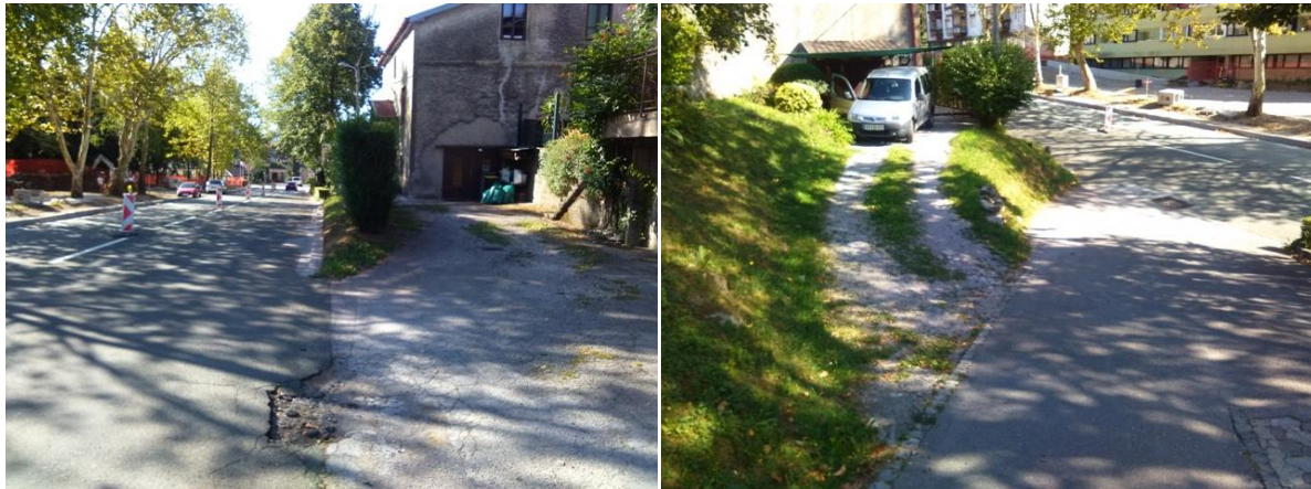
Levo-pogled z Gregorčičeve ceste; desno-pogled s poti Hrib svobode

Zaradi zelo majhne oddaljenosti med stanovanjskimi objekti ob desnem robu Gregorčičeve ceste in velikega padca Gregorčičeve ceste nastajajo med dvorišči oziroma hišami ob desnem robu Gregorčičeve ulice velike višinske razlike, ki so urejene z raznimi zidovi in strmimi brežinami. Brežine oziroma zidovi segajo do roba ceste. Prekinjajo jih dostopne ceste, ki so običajno urejene pod ostrim kotom in z velikim vzponom in velikim lomom na stiku z Gregorčičevo cesto. Zaradi tega je vsako prehajanje pešcev preko vozišča in izvoz avtomobilov na Gregorčičevo cesto zelo otežen in nevaren. Zaradi tega je potrebno namesto strme brežine urediti zid oziroma zid zamakniti globlje v brežino in s tem pridobiti prostor za pločnik. Zaradi neravnega desnega roba je mogoče poravnati desni rob ceste in s tem pridobiti dodatni prostor za pločnik in ublažitev lomov med dostopno cesto in Gregorčičevo cesto. Pločnik se ureja od stanovanjske hiše 11B mimo stanovanjske hiše 11 vse do priključne ceste za dostop do stanovanjske hiše 11A in 9. Pločnik se zaključi tik pred hišnim priključkom stanovanjske hiše 11 na dostopno cesto.